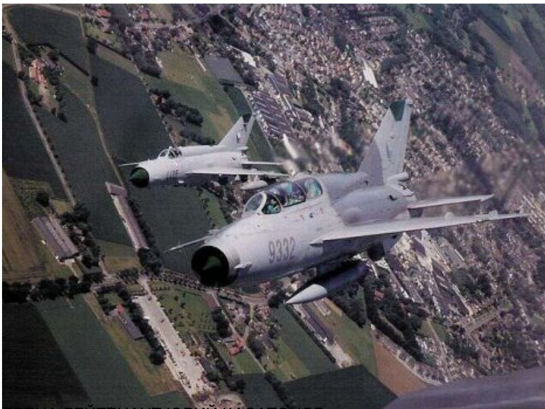
ВЕИНА, БЕИДЕНА ИТ ЮРНИА КА СМТОМОВ, КОМАНДИР