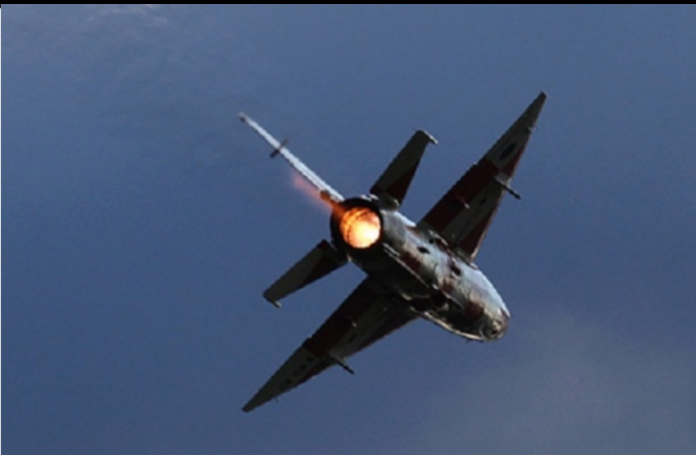
ИТ ЖИТИЦЕ ИТ ДИВИАЦИ БЕИ СРАПА И МОС АБИАЦИ ИТ И СРАД ИВА ИЮРИИ ЛУЧШИИ-ХУ ДШИИ